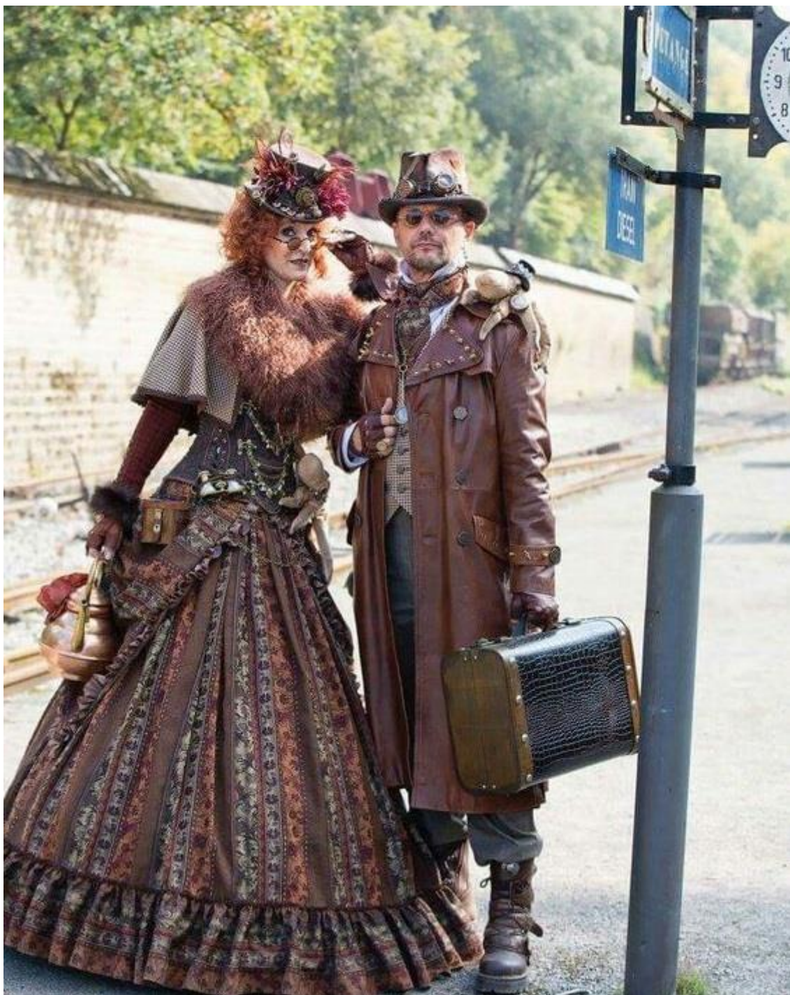
Majetní mágové/alchymisté z Marny na cestách z budoucnosti. Pro lehkou a rozhodně ne doslovnou inspiraci steampunkem však naprosto ideální pár.