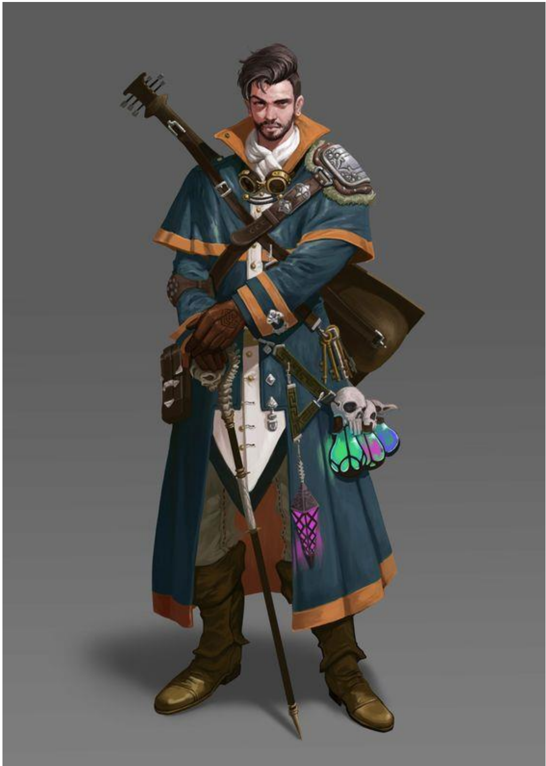
Mírně steampunkový alchymista/mág na cestách.